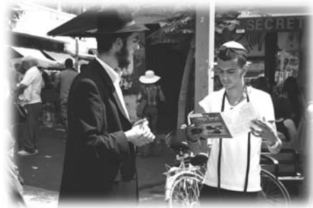
鼓勵每日配戴經文匣祈禱