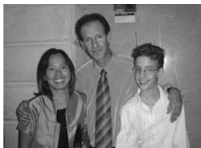
與成人禮主人家合照

衣服。我不喜歡白色衣服，因為日子久了便會變成灰色或黃色，但入鄉隨俗，我也有一件過節用的白色衣服。至於小兒更不用說，他一定有一件白色的T恤校服。這