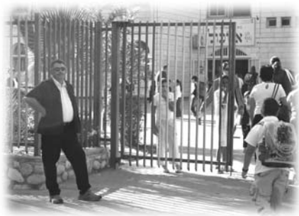
學校門口之保安員

50個座位，但不是經常客滿，所以在繁忙時間才有守衛，或者要客人按門鈴才可以內進，這樣就免了聘用守衛了。