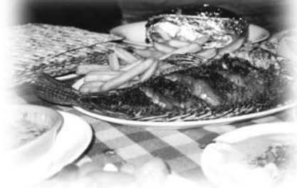
無酵餅與炸彼得魚