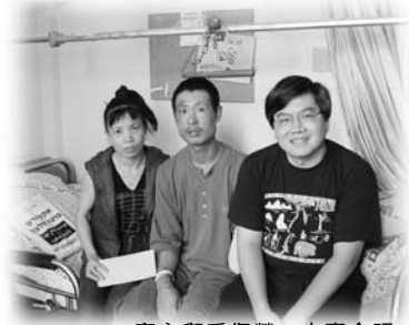
富文與受傷勞工夫妻合照

2002年6月前後，很多人問及以色列的安全問題，我們總是說我們很安全，不用擔心。這裡的人如常生活，吃喝嫁娶，跟往常沒有太大的分別。直到有一天，我們邀請教會一位姊妹及她的孩子來我們家燒烤，言談之間，開始感受到恐怖活動的威脅。事緣這位姊妹打算一家人往特拉維夫海邊一遊，可是一直沒有機會。直到公共汽車半價收費（不知道是甚麼原因，只有往來特拉維夫及別是巴的公共汽車半價收費，時至今日仍是這樣），他們打算去一趟，但我即時的反應是：「這時乘搭公共汽車很危險啊！」這位姊妹也有同感，箇中原因，大家似乎心照不宣。