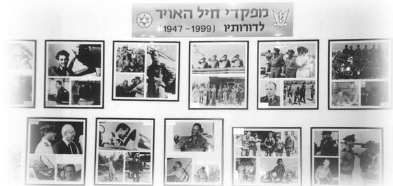
以色列空軍博物館

「在路上已經有一個阿拉伯小孩向我吐唾液。」我們說：「我們整車的中國人可以保護你呢！」他仍誓死不肯。