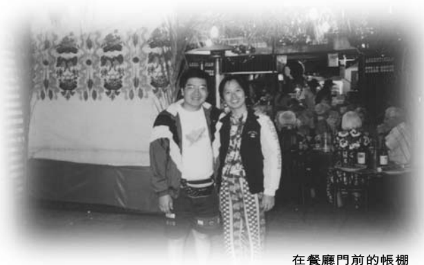
在餐廳門前的帳棚