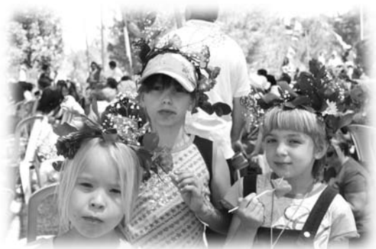
頭戴花環的小孩子慶祝七七節

類產品售賣，目不暇給。我們一家最喜歡是芝士蛋糕，有現成的材料，製作簡單，價錢便宜，回家跟著指示做，就可以製作出美味的芝士蛋糕。這一天當然不能吃肉，因為奶類的食物不能和肉混在一起吃。喜慶的日子不一定要吃肉也可以喜氣洋洋。