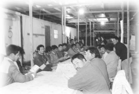
爸爸外出帶查經班

因爸媽不在而哭得好厲害。課室裡有很多玩具，很好玩，不過時間過得很快，不一會兒就要放學回家，因那天傍晚是安息日，只需上半天課，到星期日才再上學。到了星期日我覺得非常刺激，媽媽送我回幼兒園便走了，只剩下我一個人，當時很多小朋友都在哭，老師忙個不停地安慰他們，而我只顧著玩，沒有哭，我真是棒啊！到了上課時間，老師和同學都用希伯來話對答，但我一點也不明白，我想這就是爸媽所講的文化衝擊吧！我惟有很無奈地坐著。後來媽媽在接我回家途中問我：「喜歡上課嗎？」我說：「不喜歡。」媽媽當時有點失望，不過第二天放學媽媽再問我時，我就答：「喜歡。」媽媽高興得多了！