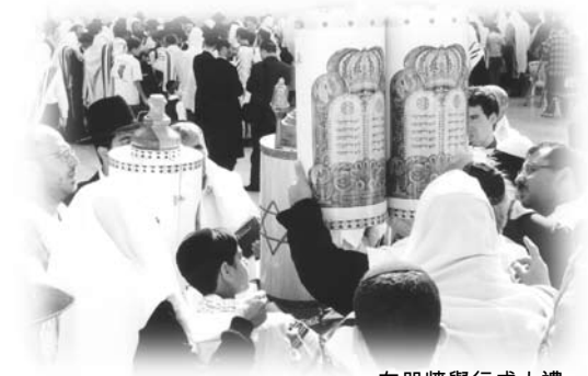
在哭牆舉行成人禮

裡的校服不像香港，每個小孩子必定有幾件不同顏色的T恤校服，節日時，慣例是穿上白色T恤的。按中國的文化，紅色是喜慶的顏色，白色是哭喪的衣服呢！