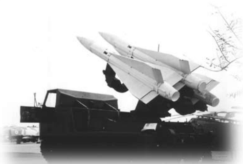
以色列空軍博物館

讀書的，大學會供應面具予外國學生，其他人則在郵局購買，戰爭結束時可以退回給政府。這段時期，以樂上幼兒園也要帶防毒面具，老師也告訴小孩子如何使用。而這裡的中國勞工無懼戰爭，仍然堅持留在以色列，他們目的只有一個——賺錢。雖有中國人、香港人、台灣人選擇離開，可是遇上前所未有的非典型肺炎的困擾，真是何處是樂土呢？