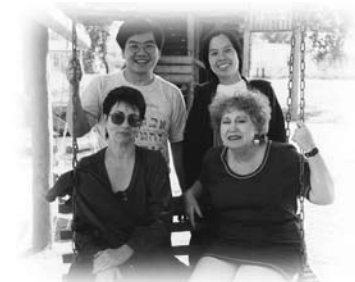
右一是我的希伯來文老師

她的丈夫則比較正統，他們去的會堂也不一樣，兒子跟爸爸去正統猶太會堂，她則帶女兒去保守派的會堂，她說：「反正去正統猶太會堂都是男女分開坐，再加上我喜歡穿褲子，而正統猶太婦女是不能穿褲子的，在那裡我就有點格格不入了！而且我也不喜歡正統會堂的氣氛，因為我從小去的會堂都會一起聚會，一起祈禱。」