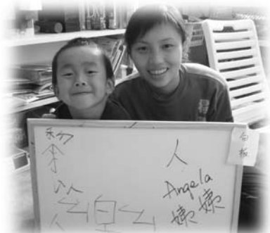
香港朋友教以樂中文

推到明天才做。某星期五，我們外出，希望在安息日來臨前辦理一些事情。在路上，我跟他說：「回家之後要做功課。」他說：「今天是安息日，不應該做功課。」我就順應他的要求說：「對！就不用做功課啦。」又在某星期五，我在早上跟小兒說：「要做中文功課。」他說：「今天是安息日啊！」我說：「太陽下山之後才是安息日，現在不是，快快去做功課。」