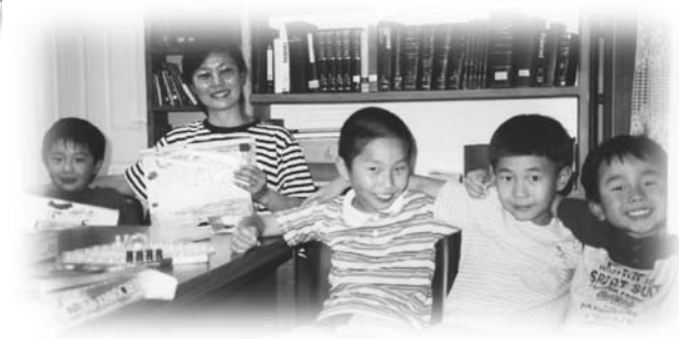
韓國老師與華人教會的學生

吃到這麼大的蝦。（蝦蟹是不潔淨的食物，要到特拉維夫的碼頭才可以買到新鮮的，一般的超級市場是沒有的，而別是巴是沙漠曠野地區，更難買得到，就算有也是不新鮮的，而且很貴。）