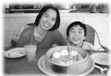
到中國餐館慶祝生日