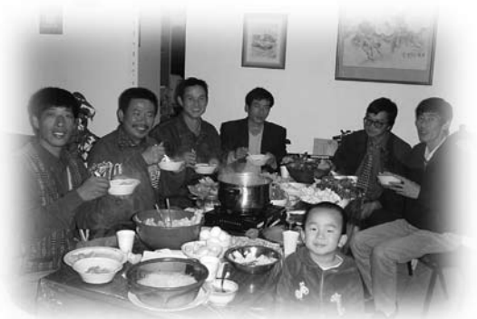
弟兄姊妹團聚吃火鍋

會的中堅分子到我家，結果星期一的晚上，十多人在家裡一起吃火鍋，非常享受，非常溫馨。