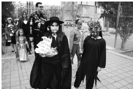
小朋友穿著各式各樣的衣服

在會堂裡，他們宣讀以斯帖記，當讀到哈曼時，所有的人都會大吵大鬧，有時講員要等他們安靜下來才可以繼續。還有，他