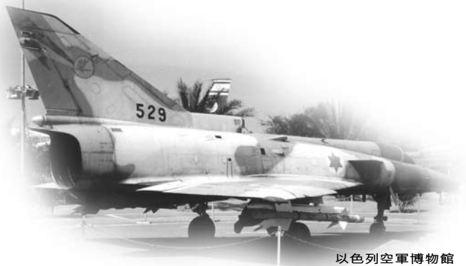
以色列空軍博物館

曾有報章報道，伊拉克薩達姆每年給亞拉法很多金錢支持恐怖活動，那些自殺式炸彈襲擊的殉道者，都會得到亞拉法的支持，給他們家人撫恤金。一條生命可以拯救整個家庭，又得到無上的光榮，所以很多人願意作自殺式炸彈襲擊的殉道者（其實殉道者是為了錢而已）。後來薩達姆自身難保，再加上以色列的報復，將殉道者家人的房屋炸毀，以色列才得以平靜一段時間。兩國的平民百姓都希望和平共處，誰也不想打仗，只有那些極端分子和恐怖分子才不想和平。