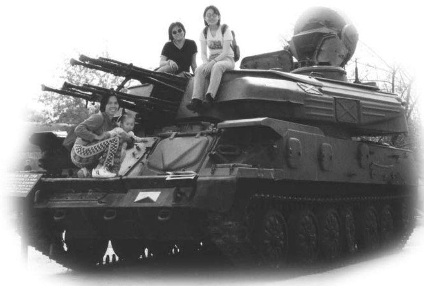
以色列空軍博物館