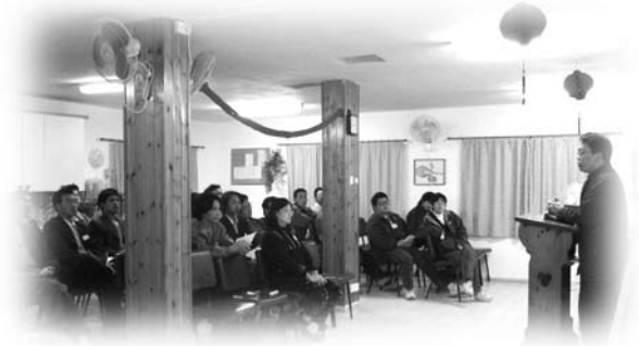
別是巴華人宣道會

宣道會)。當時，以色列有兩處是中國人可以聚會的，一處在海法的中國餐館內，隔星期聚會一次，但他們是團契形式的聚會，所以稱不上是教會；另一處是在紅海附近（以埃他），名叫涼亭教會，但他們不是純華人教會，有羅馬尼亞人、猶太人、蘇聯人等參與。所以，別是巴華人基督教會可算是第一間華人教會。