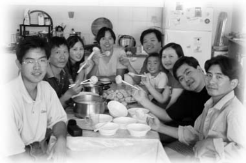
自製菜肉飽及豆漿