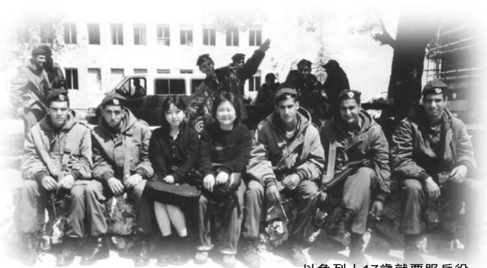
以色列人17歲就要服兵役

理想，肯嘗試、肯創新，曾多次獲教育署頒發獎狀，學校也附設聾啞學校，特為別是巴附近的城市及鄉鎮而設，學校老師也教導學生要彼此尊重及愛護。另一家長告訴我，她懷孕時不小心吃錯藥，以致女兒出生時面部扭曲，非常醜陋。同學經常欺負她，不跟她玩，見到她好像看到鬼魅一樣，後來經教育署轉介，來到這間學校就讀。剛來時，同學也避開她，但當值老師看到，就會教導那些同學一番。之後學生開始跟她玩，又幫助她。聽到這裡，我實在太感動了，我需要的就是這樣的學校。於是為了小兒，我們又再一次搬家了。