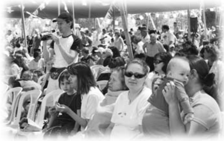
七七節在耶路撒冷舉行聚會