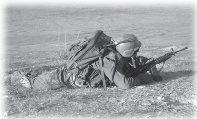
耶路撒冷稱為平安之城，卻烽火連天