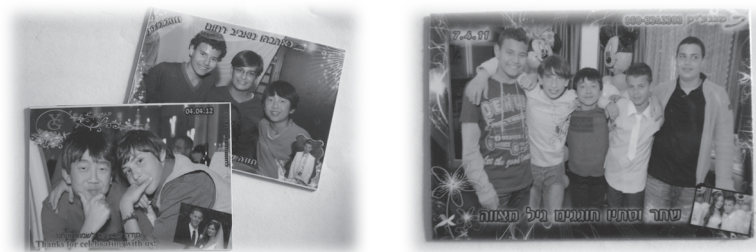
在不同場合拍攝的磁石照片