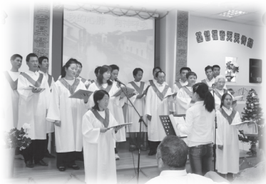
華人教會詩班獻唱

聽到我的喊叫也覺心寒，猶疑是否要打退堂鼓。那姊妹溜下來後，問我發生甚麼事，我說沒甚麼，只是很害怕。我就是不明白這東西有甚麼好玩，但以樂卻玩了好幾次呢！