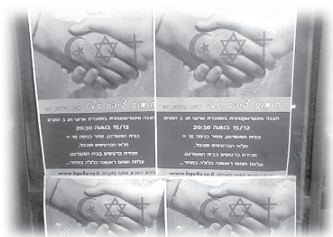
大學的宣傳海報，鼓勵宗教共融