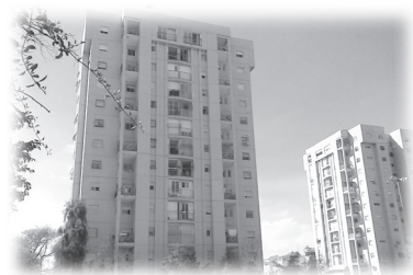
我住在這樓宇的頂層

年後與市價相比真是便宜很多，所以家裡有甚麼需要修理，我都沒有驚動她，自己付錢便是了。之前她的租客是「霸王租客」，這租客是講西班牙語的猶太人，獨個兒帶著三個兒女生活，很是可憐。她以繪畫為生，我們入住時，有一面牆已成了壁畫。當業主向她收租時，她們已靜悄悄地搬走了，還將屋內可以搬動的都搬走，只留下未結帳的水電煤帳單；有些帳單是業主的名字，所以業主一定要交付，算起來約港幣幾千塊呢！