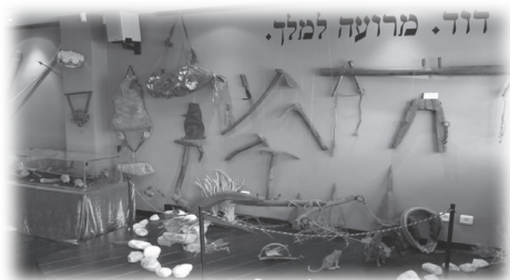
別是巴聖經展覽館