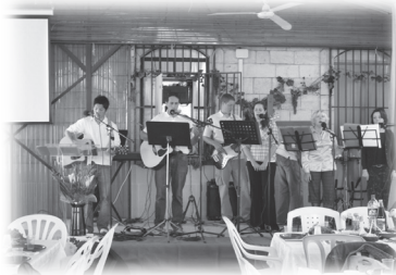
猶太人教會敬拜隊