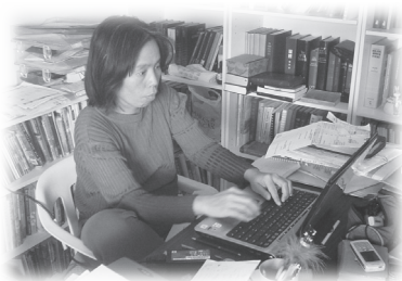
有永遠做不完的功課

遊課程，但修畢課程取得導遊牌照後，我只可以領中國團，無論如何，我報讀了，上課地點比較遠，是在特拉維夫，車程來回需三小時。