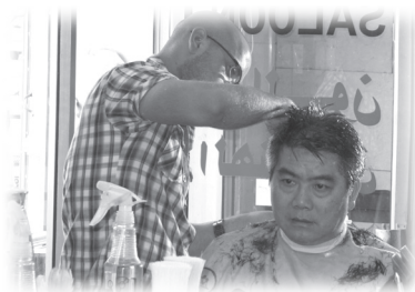
富文第一次在國外理髮