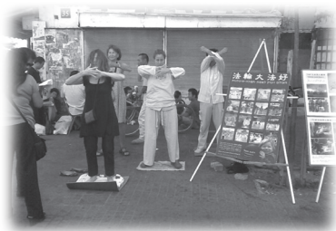
在安息日，法輪功信徒在特拉維夫鬧市活動