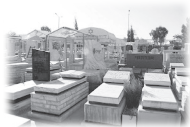
至愛離世，令人痛不欲生

都不想做人，有人過渡不了便自殺，有人在長時間後才接受過來，有些人幾天就可以重新做人，這些至愛是他們的人生意義。我們應將至愛定位在哪裡，才能成為我們終極的人生意義呢？申命記6章5節說：「你要盡心盡性盡力愛耶和華你的神（律法的中心）」，這就是人生的終極意義了。當我們愛神，不再尋問人生的意義，這便是我們的意義。後來我發現猶太教有拉比也是這樣想呢！