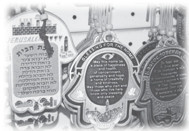
各式各樣的禱文掛牌