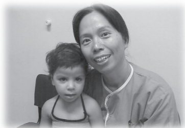
在醫院當義工時，這小女孩老是看著我，她可能未見過中國人