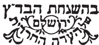
拉比監督之食品標誌