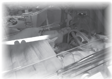
只有手掌那麼大的嬰孩