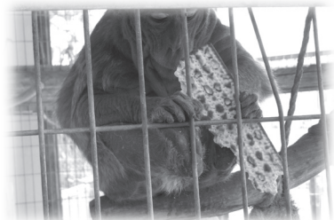
無酵節期間，猴子也要吃無酵餅