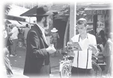
正統猶太人在街上談道

(第二聖殿時期至公元200年)，共分六條法規 (orders)，再細分六十三支部 (tractates)，範圍包括把農作物作十一奉獻、公眾節期、婚姻、侵權行為、聖殿獻祭及禮儀潔淨等各方面的規條和教導。它是當時宗教法、刑法、民法的總綱。