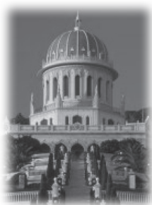
在海法的巴哈伊廟

認穆罕默德是最後的先知，故主流伊斯蘭教派均不承認他們，視他們為異端。他們主要住在海法，約有一千五百人。