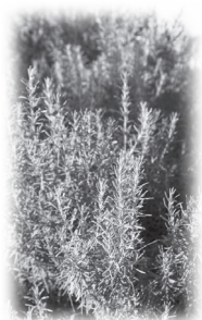
隨處可見的迷迭香

教授傾談後得出一個結論：亞迦底文像日文（本身是字母，但會借用中文），而蘇美爾文像中文（文字本身不能告訴你如何發音）。現實的香港人不可能知道這是甚麼語文，蘇美爾文是古代兩河流域的語言，是一種死的語言，我也是在這裡才知道的。