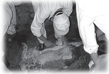
在基利心山舉行宰羊獻祭的儀式

回那裡，指導他們如何敬畏耶和華（參王下17:24-41）。今天猶太人仍然不承認他們是猶太人，他們卻自認屬以法蓮、瑪拿西及利未支派，他們主要住在基利心山和Holon。每年逾越節（撒瑪利亞人與猶太人的逾越節日期是不一樣的），他們都會在基利心山舉行宰羊獻祭的儀式。