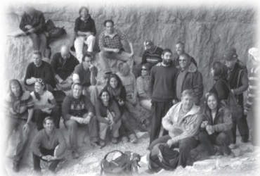
導遊班約有四十位二十至六十歲的同學