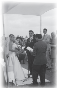
今天，新婚男士不享有服兵役之豁免