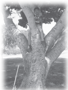
以樂愛玩，但也關心國家大事

套沒有，有洞的是工作時穿的，因為排汗多，要透氣，沒有洞的是回家時穿的；但有些人會利用此洞來穿插通訊系統的電綫。