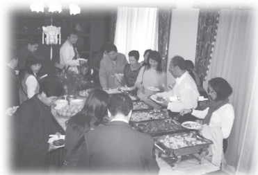
在中國大使官邸聚餐

役去了。我經常乘坐一位同學的汽車到他的城市，然後從他的城市乘巴士回家，他沒有上課，我很失落，很擔心他一去不返，我突然感到戰爭的可怕。