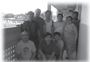
在移民大樓探望另一個中國猶太人家庭