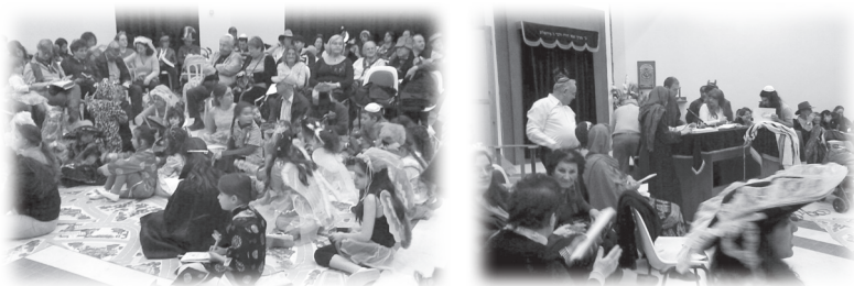
打扮別緻的小孩到會堂聚集聽讀經者讀聖經