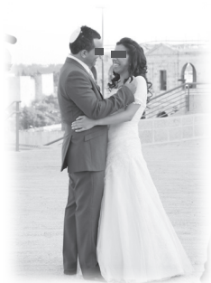
結婚是一種交易嗎？

他沒有愛。他們之間有一個交易，如果他能令她有身孕，她可以把他移民到以色列，到時互不拖欠，各行各路。後來她有身孕了，他們便結婚，二人在以色列生活下來。由於丈夫在以色列舉目無親，於是她對他說：「若你喜歡，可以留下來與我一起生活，反正你也是孩子的父親，但誰也管不了誰，我也不會用你一分錢。」就這樣，他們的「婚姻」維持了十二年。