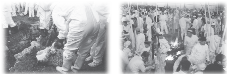
撒瑪利亞人宰羊獻祭