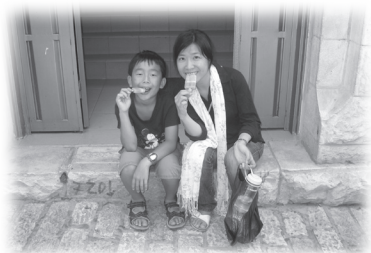
以樂在吃冰條，多開心！