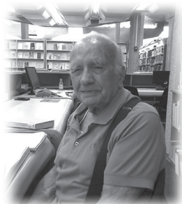
九十五歲仍然自修亞迦底文

學一個講座，題為「道成肉身」。我對他說講員解釋耶穌是道，即是神，神成為人來到世上……他回應說：「如果神成為人，那就太令人訝異了。」看來他不相信道就是神。