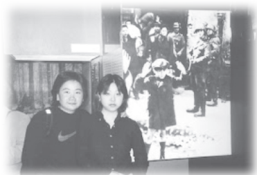
參觀大屠殺歷史館