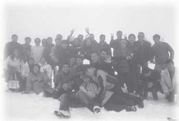
特拉維夫華人教會旅遊合照

間我聽到以下的見證。旅行前一天是下雨天，翌日雲層仍是厚厚的，有一位姊妹說要帶傘子，以防萬一，但另一位姊妹囑她不要帶，因為她們昨天已經祈禱，理應是不會下雨的；但這姊妹還是帶備了。旅行完畢回到教會，那姊妹說：「早知我聽從那姊妹不帶雨傘，整天都用不著，白拿！那姊妹的信心真大。」過了一個多小時，開始下起大雨來。