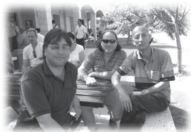
三位司機在八福堂攝

酒的，就是連觸摸也不可以，司機要求我把啤酒罐掉到街上的垃圾桶內，並囑咐勞工不要再把酒類物品丟在車廂垃圾桶。