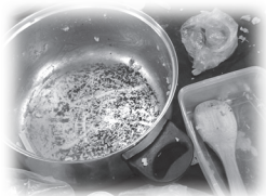
鍋底焦飯沒剩一粒