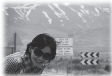
我與好友一家到歌蘭高地渡假， 背景是黑門山