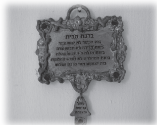
「蒙福家庭」祝福掛牌