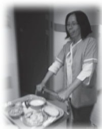
派發晚餐， 一般晚餐是吃奶類食品

她做不到，於是我問她很多問題，希望分散她的注意力，我叫她猜猜我有多大，她說二十。噢，原來她以為我比她年輕，把我視作小女孩呢！