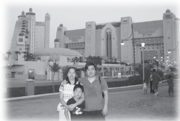
我們只有一個兒子，但也很溫馨滿足

一位禿髮人士很羨慕富文頭髮濃密，問富文有何方法，還問吃飯有沒有幫助，更追問我們吃的是甚麼。