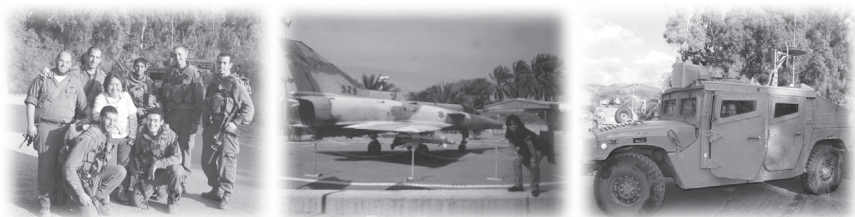
軍人、戰機、軍車令我聯想起走警報

一家都留在家裡。早上又響起警報，有兩枚飛彈射中我們的城市。以前，哈瑪斯的飛彈射程短，現在的飛彈則可射及四十公里，因此別是巴也是襲擊對象；然而對於別是巴的居民來說，這是第一次。新聞不斷報導最新情況，射程三十公里的城市小鎮已經戒嚴，有一些居民已搬到較安全的地方；我們的城市仍未戒嚴。每逢星期三晚，我都會到特拉維夫教會留宿，因為星期四是我的導遊班上課日，早上六時半便要乘車到不同地方旅遊學習。今晚，我們一家決定到特拉維夫教會暫住，反正以樂停課，富文星期六需要在教會講道，另外有一個從香港來的留學生家庭也跟我們到教會暫住。