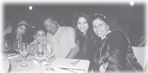
在婚宴上認識的貝都因家庭

爸爸有多少孩子嗎，她的女兒卻搶先回答：「連他自己都不知道。」我不禁大笑起來。這太太看到我這樣開心，很是羨慕，於是我們進深交談起來。我告訴她一日大笑三次對身體好。人生充滿煩惱，面對煩惱，我們可以喜眉笑眼，也可以愁眉苦臉，那為甚麼不以笑臉來面對呢！翌日晚上，她來電問我甚麼時候探望他們一家，她還告訴我早上她無緣無故大笑了三聲，她女兒問她發生甚麼事，她便告訴女兒是我教她這樣做的，真有意思！