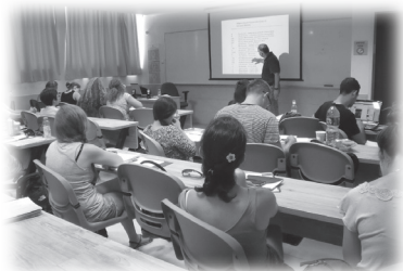
別是巴便古利安大學中文班上課情形

兒僵硬了，頭部不能轉動，我於是自告奮勇給他做穴位按摩。不一會，他的脖頸肌肉鬆弛了，可以轉動了，瞬間這消息被廣傳，所以每次當老師講解景點的時候，總有人坐在我前面要求我替他按摩。