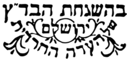
拉比监督之食品标志

在超级市场里，往往见到一个标志，那是指经过拉比特别祈祷的食品。一次，友人问我以色列的拉比是怎样过活的，是谁给他们工资的？其实不少地方会聘用他们，例如工厂、餐馆、屠宰场、会堂、宗教学校，而工作种类也多方面，例如为婴孩施行割礼、主持成人礼、婚礼、丧礼、洁净礼，每天早上为餐馆点火祈祷、检查食物等。超市的 Kasher（犹太教饮食条例）食物，都需要拉比检定。至于屠宰牛羊鸡等食物，都有规定，他们会用盐水放血，虽然放得较干净但肉类会较咸，煮食时不用放太多盐。如果屠宰时发现牲畜有骨折便不能食用，所以这些肉类比其他不是拉比屠宰的要昂贵得多。