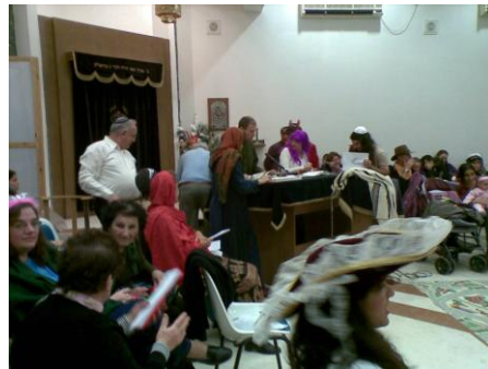
打扮别致的小孩到会堂聚集听读经者读圣经（会堂聚会可以拍摄，因为普珥节不算圣经节期）