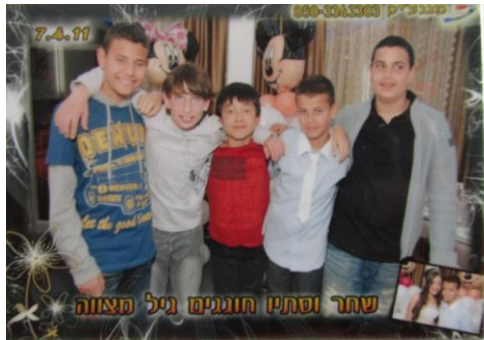
一對兄妹之成人禮