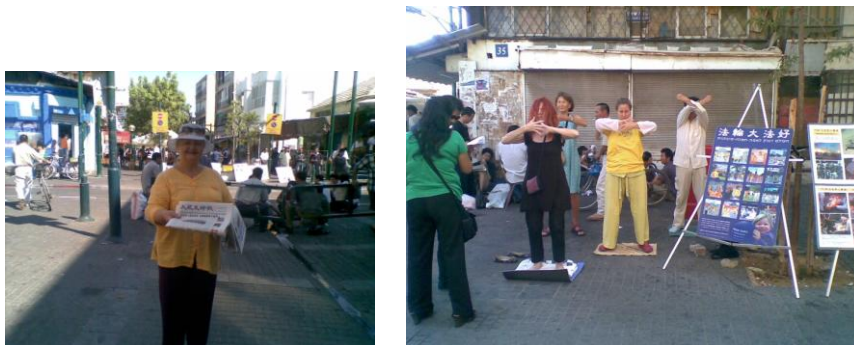
在安息日，法轮功信徒在特拉维夫闹市活动

法轮功在以色列也颇活跃。有一些中国劳工为了在以色列逗留而改信法轮功，藉此向以色列政府寻求政治庇护。