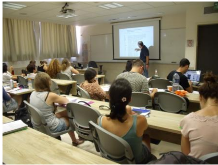
别是巴便古利安大学中文班上课情形