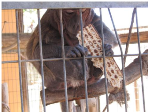
无酵节期间，猴子也要吃无酵饼

逾越节晚餐有一个程序，便是将三个无酵饼放在袋子里，以代表亚伯拉罕、以撒、雅各；但基督教则代表圣父、圣子、圣灵。在 2008 年，犹太人候活牧师将两者相连起来，以撒是中间的饼，是一个祭，因亚伯拉罕曾将他当作祭物献给神；而主耶稣同样是一个祭，祂为我们的罪成为挽回祭。很有意思。