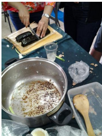
锅底焦饭没剩一粒