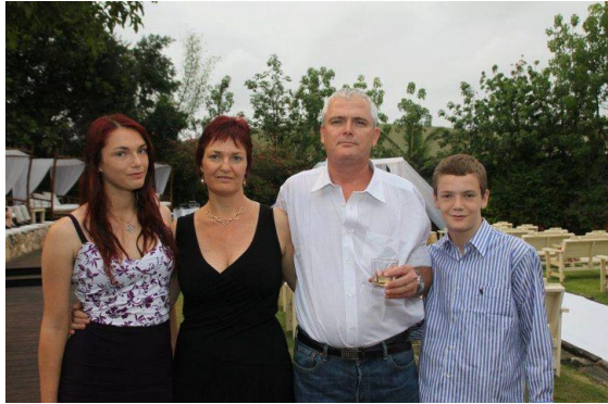
俄依(右一)与他的家人