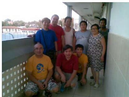
在移民大楼探望另一个中国犹太人家庭

这家庭男主人的妈妈是俄罗斯犹太人，爸爸是中国人，后来妈妈带着女儿到俄罗斯，他则与爸爸在中国生活。他跟中国人结婚后育有一女，这女儿也生了一名女儿，按理他的女儿及外孙女不算是犹太人，但因为他在生，便可以将所有成员从中国带到以色列。他们在别是巴居住了一段时间，后来因为工作而搬往特拉维夫。