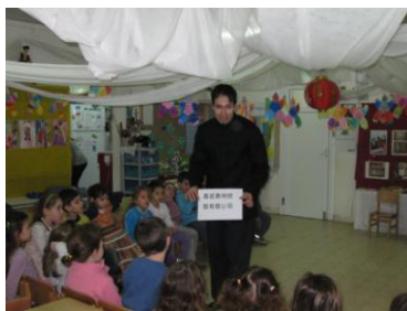
介绍自己在中国的公司