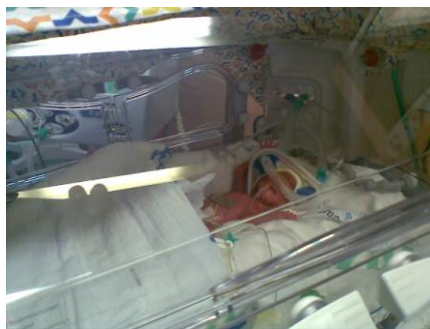
只有手掌那么大的婴孩

生命何价？那是用金钱可以衡量的吗？你会如何选择呢？有些人很随便放弃自己的生命，值得吗？