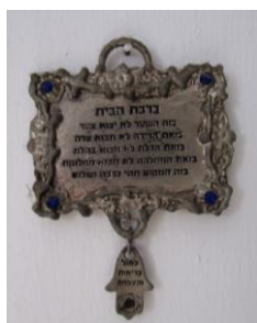
「蒙福家庭」的祝福挂牌