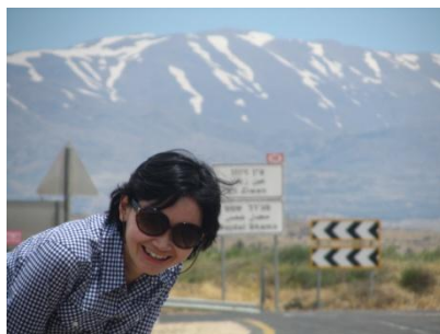
我与好友一家去歌兰高地渡假，背景是黑山。