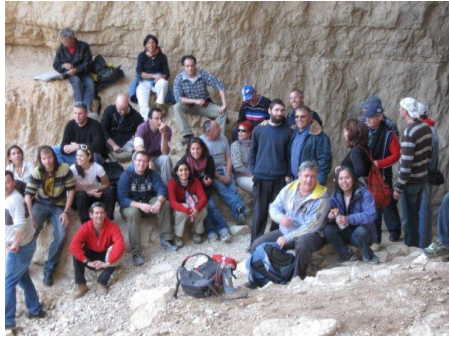
导游班约有四十位二十至六十岁的同学