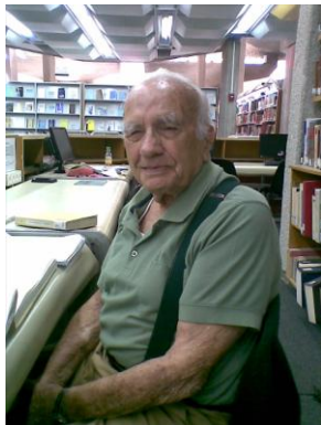
九十五岁仍然自修亚迦底文

2009年的一天，我在图书馆认识了一位九十五岁的老伯伯。这位鬓发斑白，爱穿吊带裤子，戴着助听器的长者，总是在埋头苦干抄写亚迦底文，他每星期都到图书馆一次研究亚迦底文和阅读期刊，起初我以为他是有关课题的退休教授，原来他只是为了兴趣而已。他会说一两句中文，每次见到我都会用中文跟我打招呼。踏入2012年已很少遇见他。