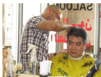
富文第一次在国外理发

回想我第一次在以色列理发店理发，是十四年前的事。那一次我走进理发店，我说我希望修剪一点便可，老板说要四十元。后来我想反正都是修剪，不如多剪一点，于是告诉老板把头发尽量多剪，不用客气，谁知结账时，老板却说要七十元。原来剪一点点是四十元，多剪是七十元，从此以后，我再没有踏足以色列的理发店，都是我的朋友们帮我修剪。